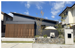
エイジングハウス

自然素材と中庭を活かしたモデルハウスは、快適さと開放感を兼ね備えた住まいです。中庭は日当たりを改善し、自然光で明るく健康的な空間を提供。家事動線の効率化や子育てのサポートにも役立ち、日常をより豊かに彩ります。ぜひご覧ください。