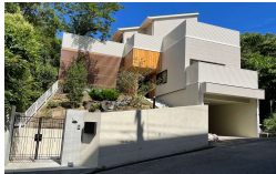
高性能住宅コンソーシアム

愛着ある我が家をリフォームするなら、性能向上リノベで価値ある家に蘇らせることができます。エアコン1台で家全体が寒くない!暑くない!光熱費が安くなり、家じゅう快適で健康に、安全に暮らせます。