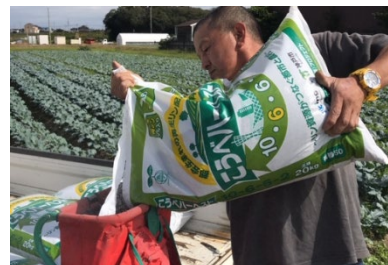
(こうべハーベスト)

市内産資源を有効活用するため、下水から回収された「こうべ再生リン」を配合した肥料「こうべハーベスト」の農業者等への購入支援や新たな利用品目拡大に向けた実証栽培等を行うとともに、市内産の堆肥やペレット堆肥及び稲わら等の利用促進をはかる。