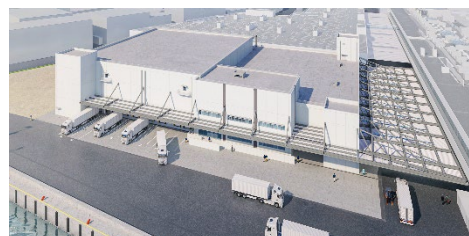
(冷蔵庫新築工事完成予定パース)

中央卸売市場本場の機能強化をはかるため、冷蔵庫新築工事や水産仲卸売場の設計を進める等、引き続き再整備事業に取り組むとともに、東部市場、西部市場においても、市場運営に必要な機能を維持するための施設改修を行う。