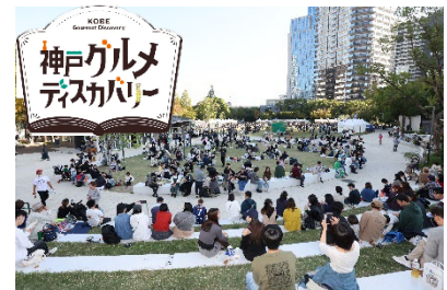
(神戸グルメディスカバリー)

神戸が有する豊かな食文化をきっかけとした国内外からの誘客を促進するため、神戸を象徴する食をテーマにした PR イベント（神戸グルメディスカバリー）を実施する。