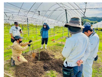
(こうべ果樹の就農学校)

新たな担い手確保のため、新規就農者や市内での就農予定者を対象に、国の就農準備・経営開始支援事業等を活用し、その経営や就農に係る資金を支援する。また、里山・農村エリアへの移住を促進するとともに、半農半X等の農業者等、多様な担い手を育成する。