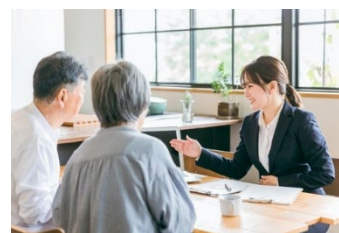
(シニアキャリア相談)

事業者の人材確保およびシニア層の活躍の場の拡大のため、市内事業者への訪問・相談や事業者向けセミナーを通じて、シニア求人の効果的な開拓を行うとともに、キャリア相談やセミナー、合同就職面接会・出張相談会等、求職者に向けた多面的な就労支援を実施する。