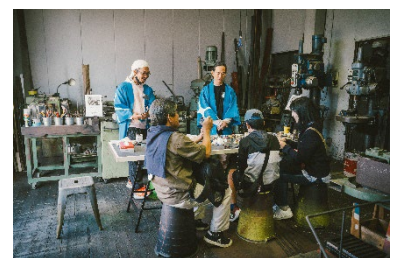
(オープンファクトリー)

市内事業者における新規事業創出等による高付加価値化をはかるため、新規事業開発プログラムの提供や都市型創造産業に係るクリエイティブ人材との協業等を支援するとともに、チャレンジ精神旺盛な企業同士の業種の枠を超えた関係構築や協業を生むため、交流の機会を創出する。