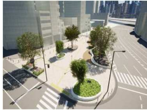
きらら広場 整備イメージ