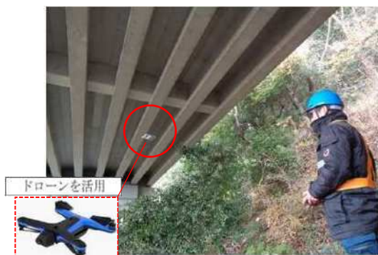
橋梁点検 (北区 岩谷橋)

また、緊急輸送道路において、橋梁の耐震化を進めるとともに、路面下空洞調査の計画的な実施による速やかな補修を進める。