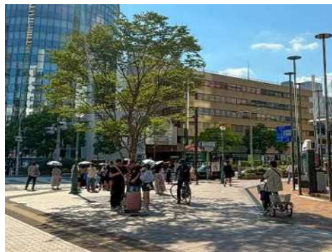
こうべ木陰プロジェクト(神戸国際会館前)

さらに、市有遊休地において緑を活かした活用を図るため、玉津健康福祉ゾーンにおいて新たな公園整備に向けた検討を行うほか、神戸の魅力や緑の取組みを国内外に発信するため、「2027年国際園芸博覧会」(横浜市)への出展に向けた設計を行う。