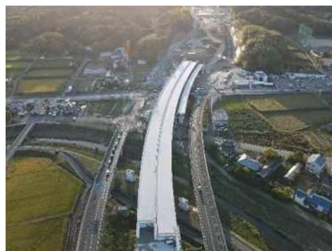
神戸西バイパス 整備状況