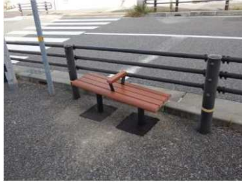
ベンチの新設 (垂水区 高丸)

また、坂道の道標設置を進めることで、「坂のまち神戸」としてのまちの魅力を向上させる。