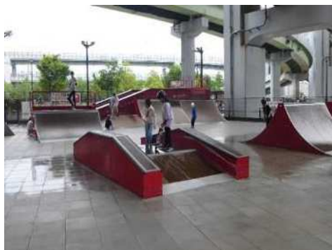
スケートボード広場 (みなとのもり公園)