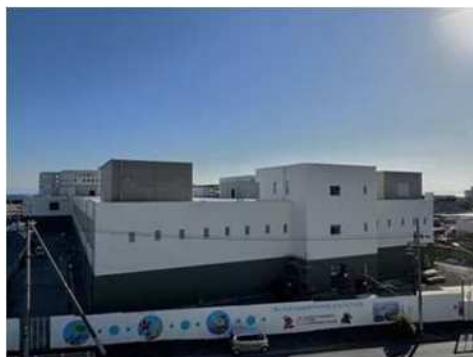
西部処理場北系整備（長田区）