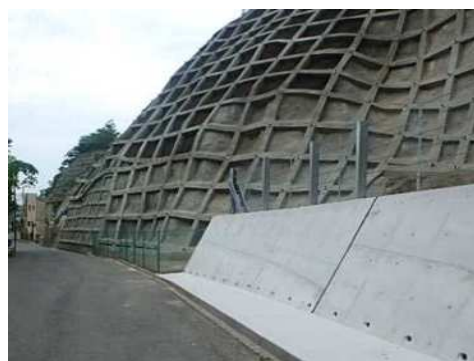
土砂災害特別警戒区域の斜面对策後 (灘区 箕岡通)