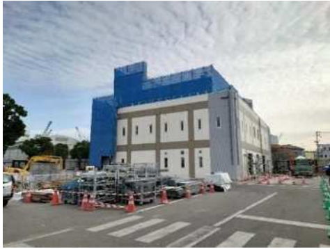
新東川崎ポンプ場整備事業 (中央区)