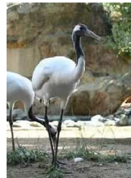
タンチョウ「天女」来園 (令和6年5月来園)