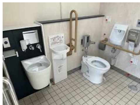
公園トイレチェンジアクション (兵庫区 遠矢浜公園)