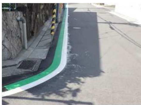
路側帯のカラー化 (東灘区本山第一小学校付近)

特に通学路について、教育委員会や警察等と連携し通学路の危険箇所を把握するほか、点検及び対策を行う「通学路プログラム」を引き続き実行するとともに、通学路のカラー化計画（令和6年3月策定）に基づき、歩行者空間の確保やドライバーへの注意喚起を目的とした路側帯のカラー化を推進し、通学児童の安全性向上を図る。