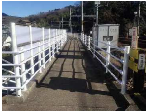
手すりの整備後 (神戸電鉄 箕谷駅周辺)