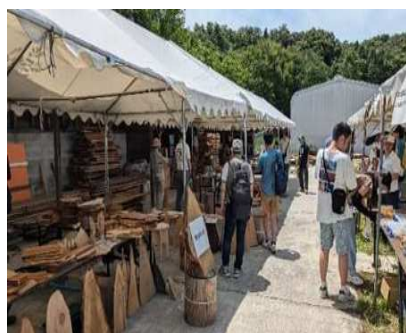
木材普及イベント（しあわせの村）