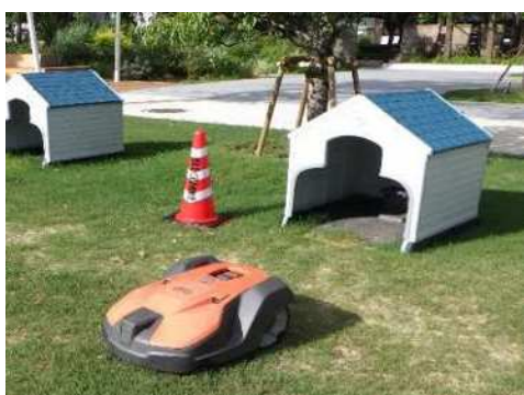
自動芝刈機 (東遊園地)

さらに、職員技術研修所では、研修フィールドを活用した研修を行うとともに、外部機関が実施する研修の積極的な受講を推進する。