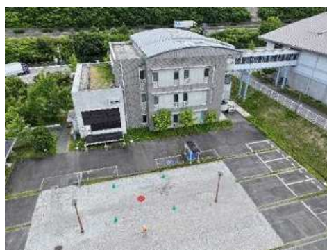
職員技術研修所 外観