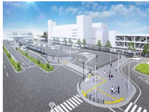
西神中央駅バスロータリー 整備イメージ