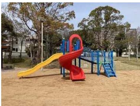
遊具の改築更新 (西区 糀南公園)

さらに、公園のトイレを誰もが安心して利用できるよう、バリアフリー化や洋式化等による「公園トイレチェンジアクション」を推進する。