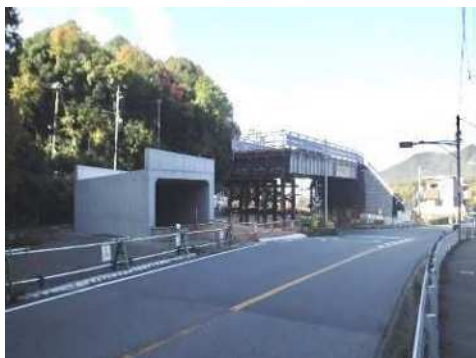
国道428号(箕谷北) 整備状況

また、「神戸市無電柱化推進計画」に基づき、引き続き着実に無電柱化事業を推進する。