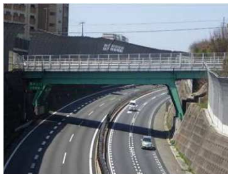
橋梁補修 (垂水区 高丸橋)