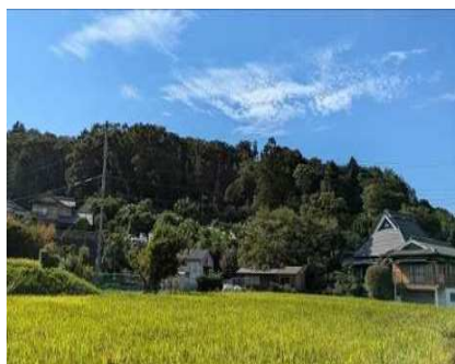
里山広葉樹林（北区山田町）

これらの取組みをより積極的に展開していくため、「森の未来都市神戸推進本部（仮称）」を立ち上げ、官民や庁内の横断的な連携を強化し森林施策を推進する。