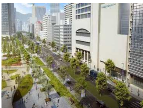
税関線道路改良工事 東遊園地付近からの全体イメージ