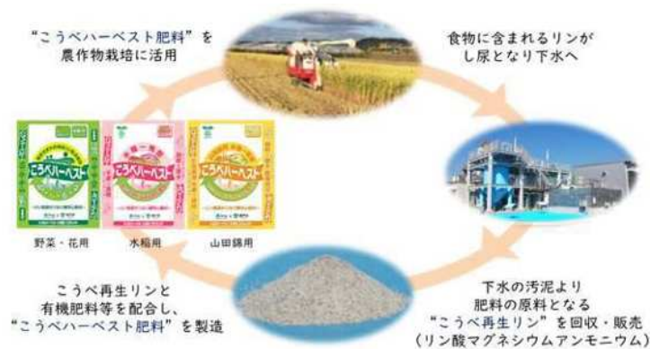
資源循環「こうべ再生リン」プロジェクト