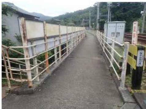
手すりの整備前 (神戸電鉄 箕谷駅周辺)

また、まちを明るくし、誰もが安全・安心に通行することができるよう、住宅街や信号機のない横断歩道等において、まちなか街灯（防犯灯）の増設を推進する。