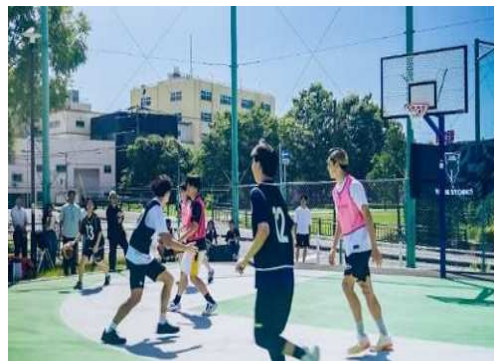
バスケットゴール（長田区 神楽公園）

また、公園の良好な環境を保ちつつ将来にわたり持続的に管理・運営していくことを目的として、若年層や子育て世代を含むあらゆる年代の方々が愛着や帰属意識を持ち、気軽に公園管理に参加することが出来るような仕組みづくりに取り組むほか、公園敷地の一部をレンタルスペースや菜園として貸し出す「オープンレンタルスペース」や「こうべ菜園プロジェクト」等の実証を進め、公園を活かした新たな価値やにぎわいの創出を図る。