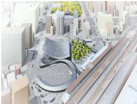
神戸駅前広場 整備イメージ