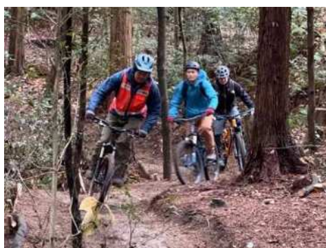
マウンテンバイクコース (森林植物園(学習の森))