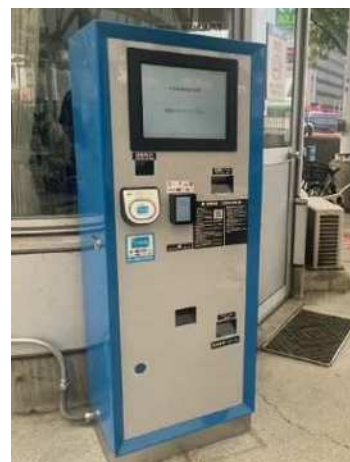
駐輪場定期券WEBサービス発券機