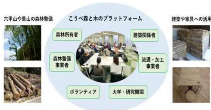
こうべ森と木のプラットフォーム 模式図