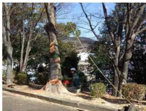
公園の危険木伐採