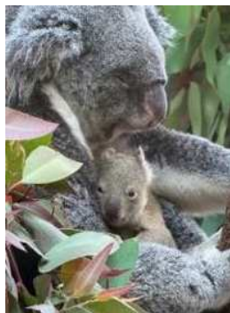
コアラ (令和6年6月誕生)

さらに、ジャイアントパンダの共同飼育繁殖研究の継続について、引き続き中国側と協議を進めていく。