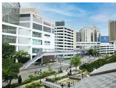
ハーバーランド東(弁天)デッキ 整備イメージ