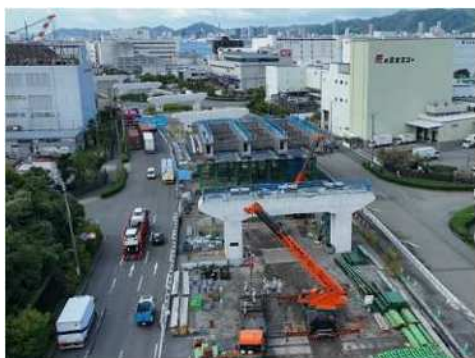
大阪湾岸道路西伸部 整備状況

阪神高速神戸線や第二神明道路の慢性的な渋滞を解消し、神戸さらには関西全体の経済を発展させるため、ミッシングリンクとなっている大阪湾岸道路西伸部や神戸西バイパス等の整備を促進する。