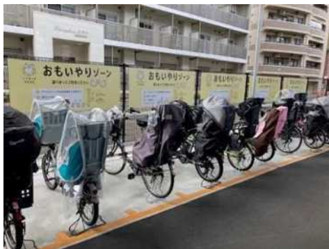
おもいやりゾーン (東灘区 青木駅前自転車駐車場)

さらに、神出山田自転車道において、民間事業者と連携して、シェアサイクルを引き続き実施するとともに、地域行事と連携したサイクリングイベントの開催等、更なる利活用を促進するための検討を行う。