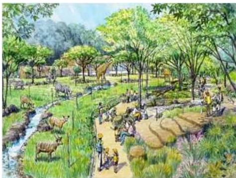
サバンナゾーン 整備イメージ（近景）

また、王子動物園において、プールの解体撤去工事が完了した後、サバンナゾーンや爬虫類館等の整備工事に着手する。