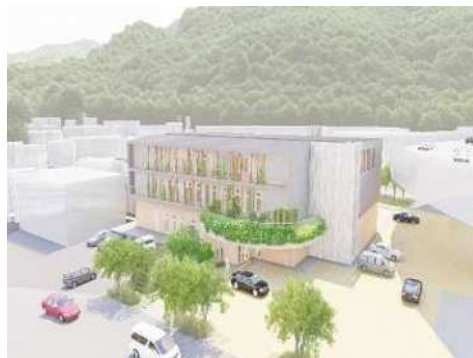
北区における新たな建設事務所 整備イメージ