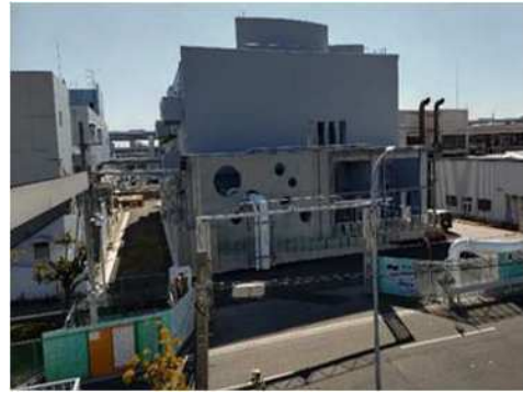
魚崎ポンプ場改築更新事業 (第1期) (東灘区)