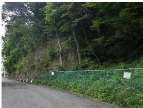
土砂災害特別警戒区域の斜面对策前 (灘区 箕岡通)

さらに、パトロール等による違法盛土の監視・指導及び既存盛土の安全性把握調査を行い、盛土規制法の適正な運用に努める。