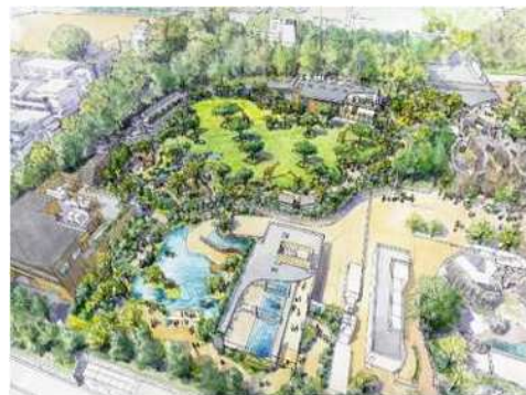
サバンナゾーン 整備イメージ（遠景）