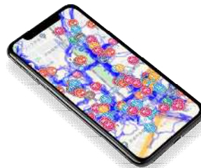
スマートフォン版（イメージ）