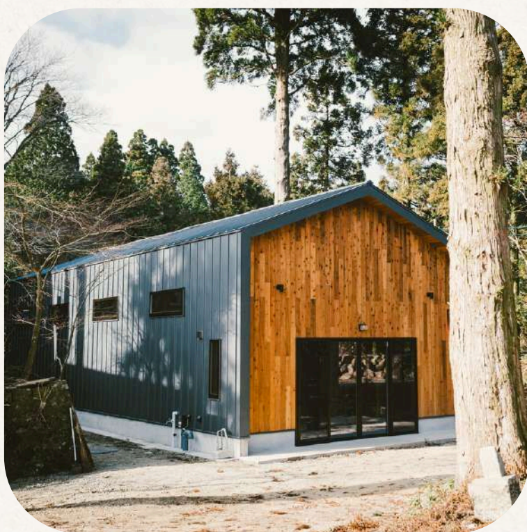
合同会社 六甲山クリエイティブラボ Mt.Rokko creative lab