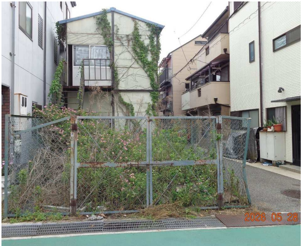
対象地側面（南）より撮影