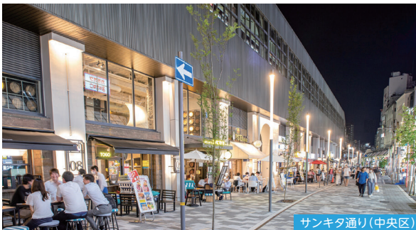
サンキタ通り(中央区)

道路や公園、広場などの公共空間などを、居心地よく魅力的な場所にするには、市民や観光客が思わずたずみたくなるような「まちの居場所」を生み出します。そのような場所は、まちの表情を豊かにし、そこには自然と人が集まり、イベントや交流をよび起こすことにつながります。