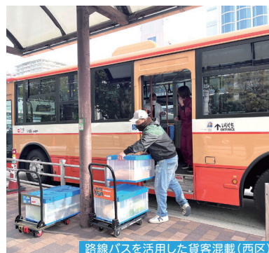
路線バスを活用した貨客混載(西区)