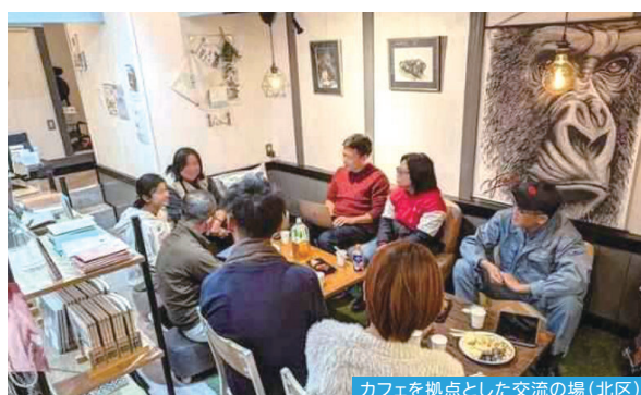
カフェを拠点とした交流の場(北区)