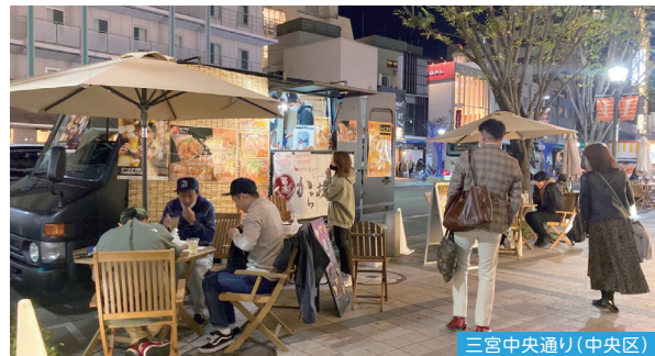
三宮中央通り(中央区)