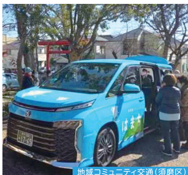
地域コミュニティ交通(須磨区)

住宅地の中にあるお店や気軽に利用できる交通手段など、居住者や来訪者など、さまざまな立場の人にとって快適な環境を充実させることで、新たなにぎわいの創出や暮らしやすいまちづくりを実現することにつながります。