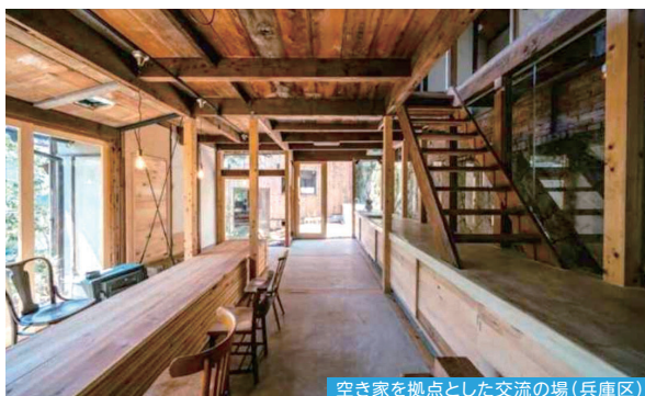
空き家を拠点とした交流の場(兵庫区)

まちなかに点在する空き家や空き地が、従来の枠にとらわれないリノベーションによって店舗やコミュニティスペース、農園などに生まれ変わることによって、地域の課題が解決され、人々の交流や新たな活動が生まれます。こうした変化は、まちの魅力と価値を大きく高める原動力となります。