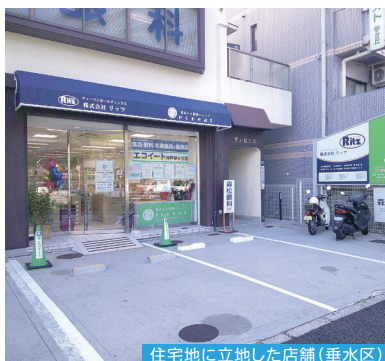
住宅地に立地した店舗(垂水区)