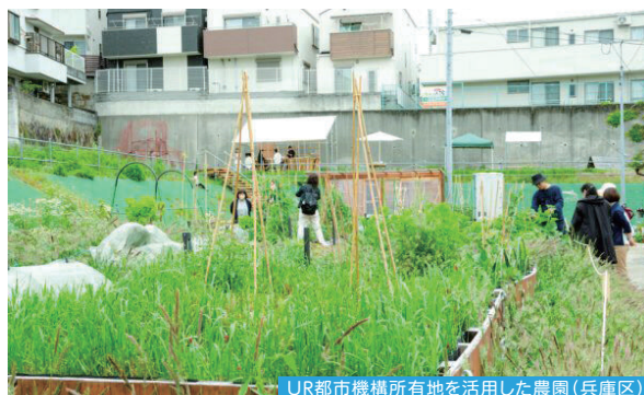
UR都市機構所有地を活用した農園(兵庫区)