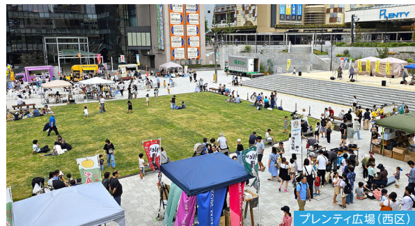
プレんティ広場(西区)