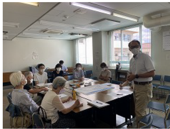
ブロック別勉強会の様子

他ブロックでも、ご希望があれば勉強会を開催したいと考えています。どなたでも、まちづくり協議会役員へご要望ください。よろしくお願いいたします。