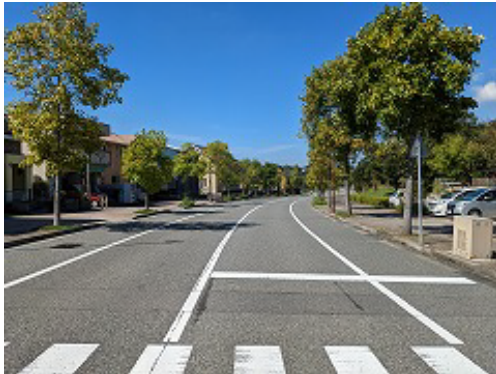
視察候補地区の様子（垂水区・舞多聞）

まだ残暑厳しいですが、気候が落ち着いた頃に事例視察を行い、紙面でみなさんにご報告したいと思っています。