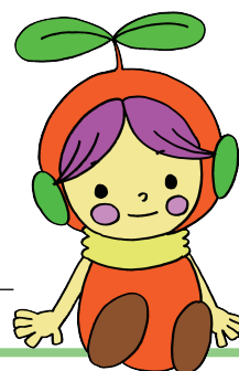
北区のマスコットキャラクター 「キタルさん」

毎週水曜日の午後2時から5時までの間、鈴蘭台プラザ2階にある鈴蘭台相談所を開設しています。土地区画整理事業などについて個別にご相談のある方は、お気軽にお越しください。